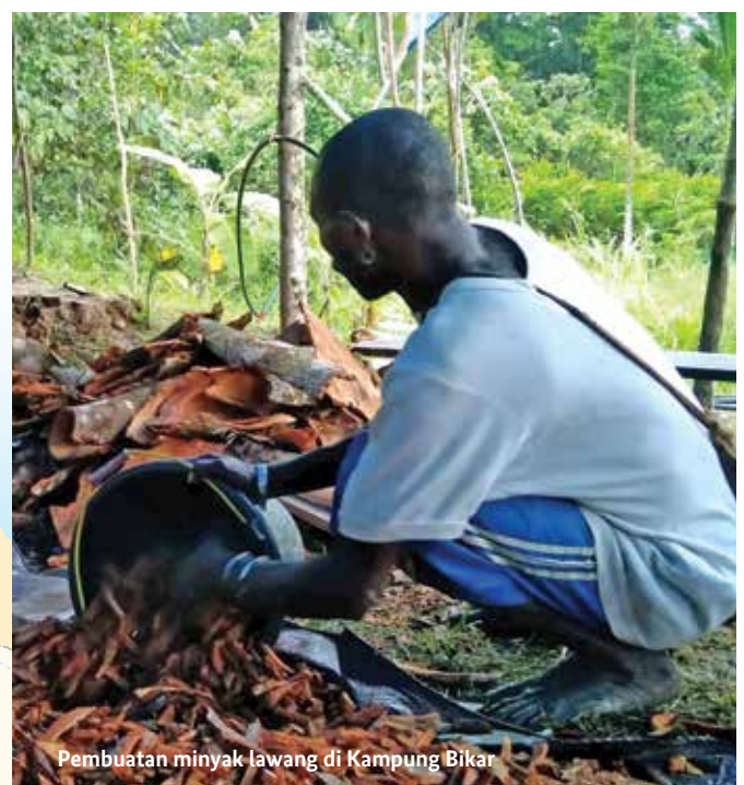
Pembuatan minyak lawang di Kampung Bikar