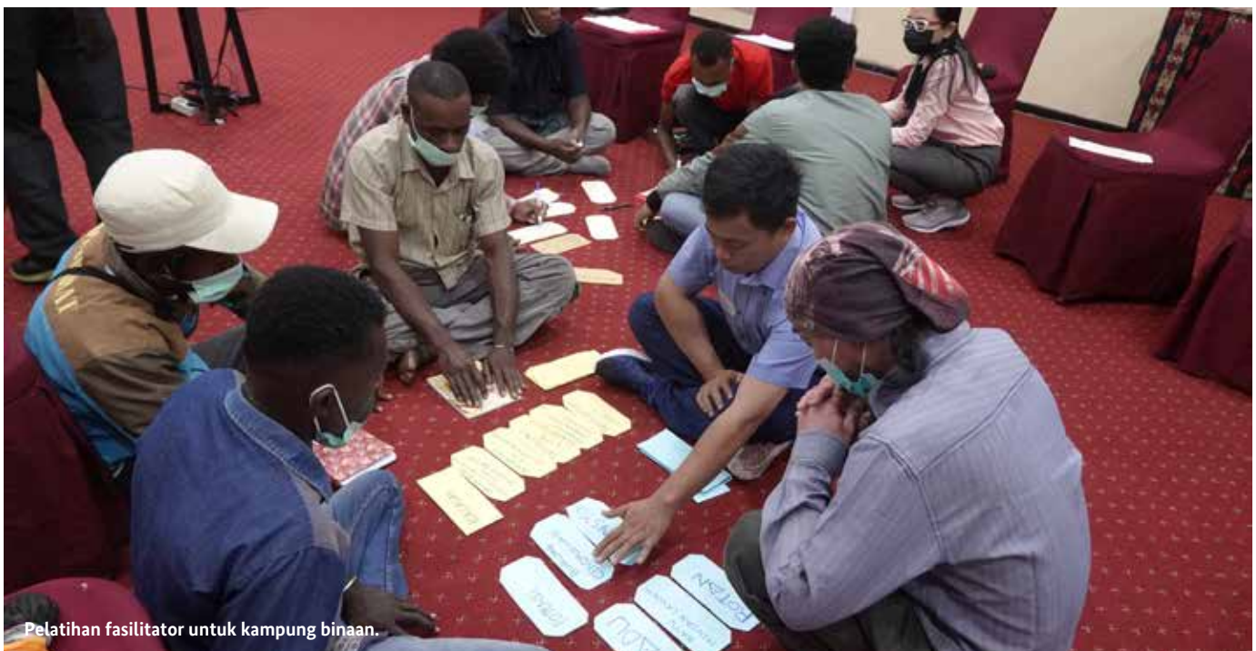
Pelatihan fasilitator untuk kampung binaan.