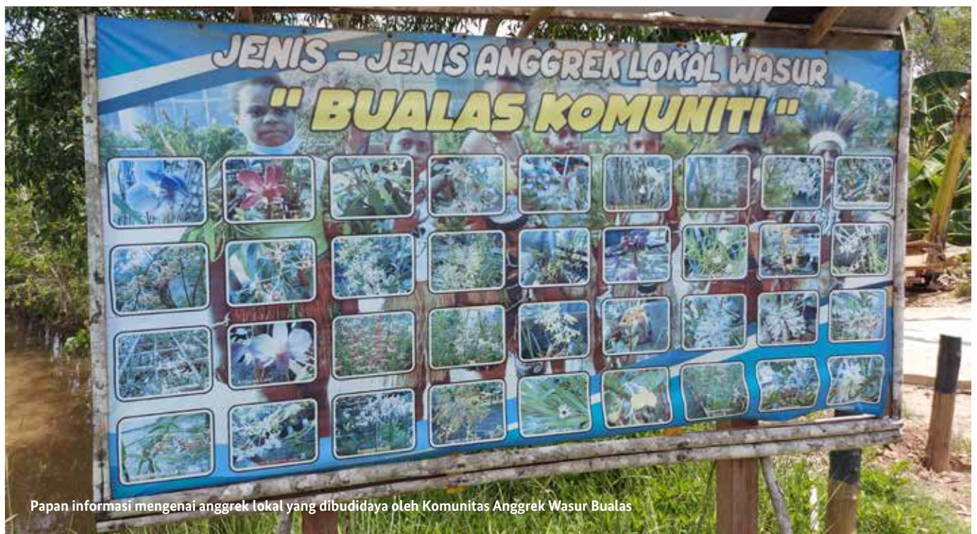
Papan informasi mengenai anggrek lokal yang dibudidayakan oleh Komunitas Anggrek Wasur Bualas

Wasur bukan sekadar kampung; ia adalah gerbang menuju petualangan. Kawasan strategis ini ditetapkan sebagai Taman Nasional Wasur pada tahun 1997, sebuah keajaiban alam yang luasnya mencapai lebih dari 400.000 hektare.