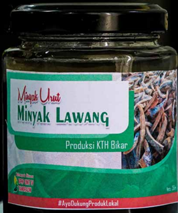
Produk minyak lawang dari Kampung Bikar