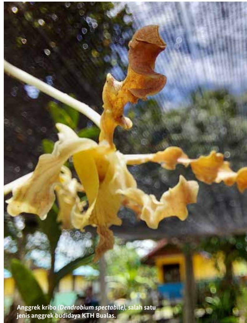
Anggrek kribo ( Dendrobium spectabile ), salah satu jenis anggrek budidaya KTH Bualas.

Dukungan dan kerja sama dari berbagai pihak, termasuk pendamping, masyarakat, dan pemerintah, sangat dibutuhkan agar proses perizinan usaha bagi masyarakat lokal bisa lebih mudah dan lancar.